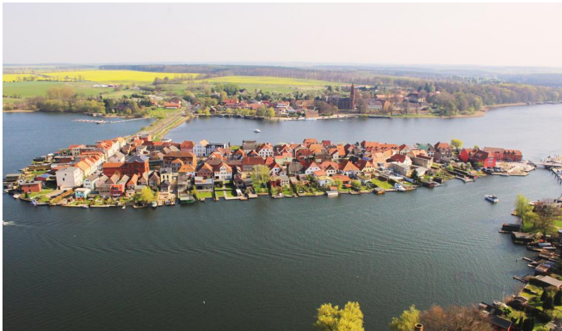
Die Drehbrücke rechts im Bild